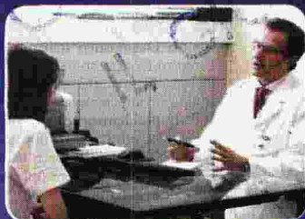
Check up e prevenzione: oltre 40 anni di esperienza

CDI: UN'ECCellenza DELLA SANITÀ LOMBARDA