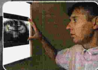
Servizi specializzati di Odontoiatria