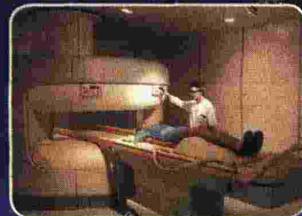
La risonanza magnetica aperta