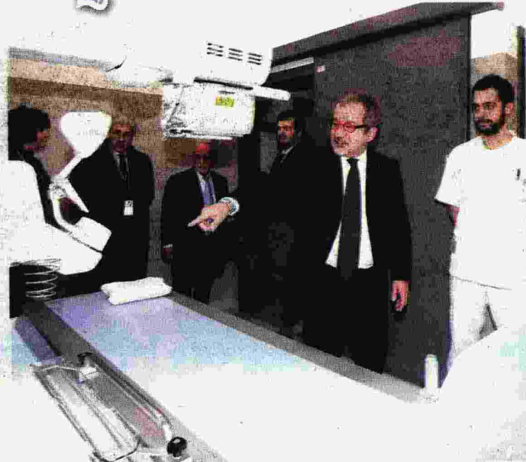
A sinistra Piazza Gae Aulenti. Sopra Roberto Maroni durante l'inaugurazione della nuova sede