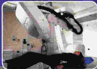
Cyberknife, robot radiocirurgico all'avanguardia