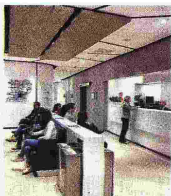
L'interno della sede di Piazza Gae Aulenti a Milano